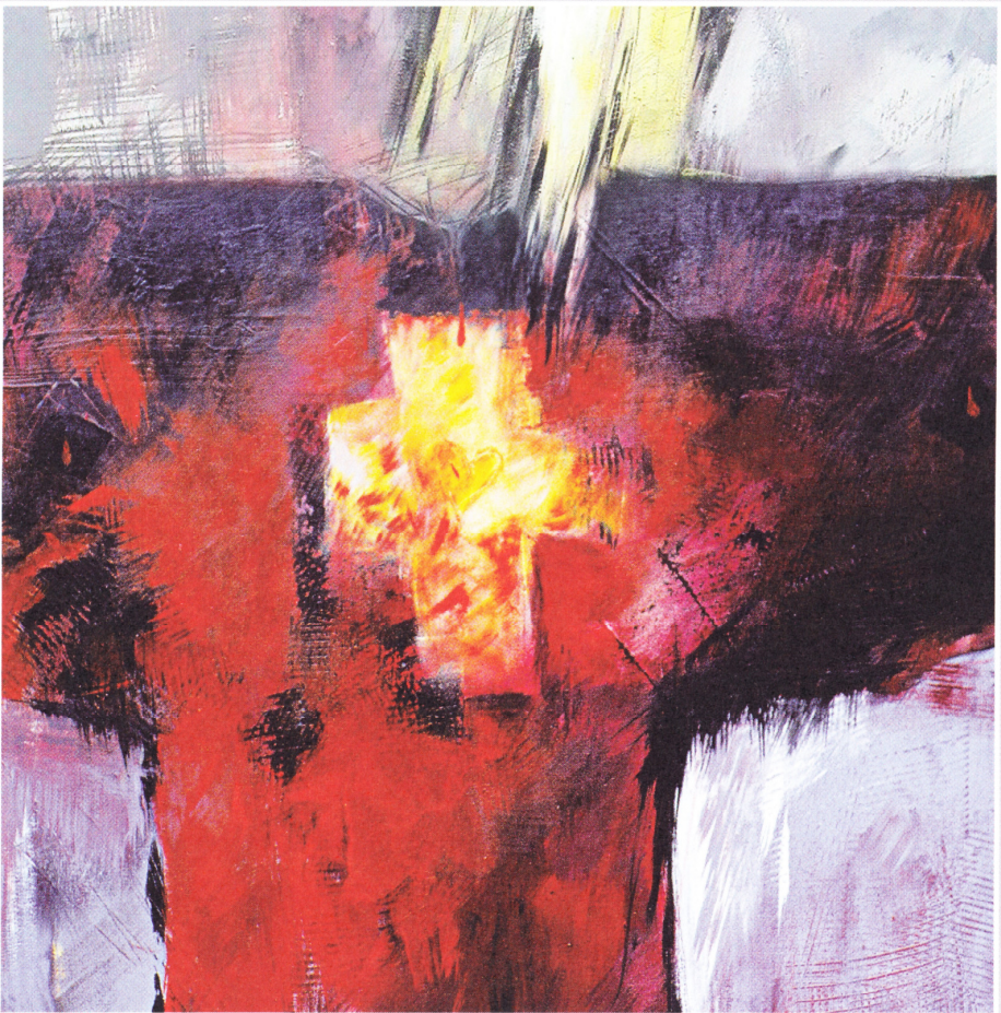
Manfred Hartmann, „Leuchtendes Kreuz“, 2004, Acryl auf Leinwand